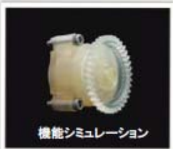
機能シミュレーション