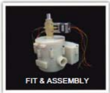
FIT & ASSEMBLY